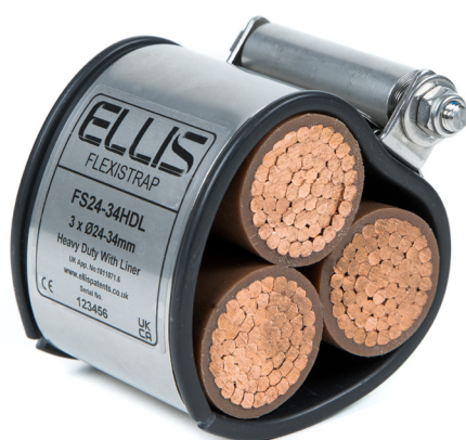
RÉSISTANCE STANDARD UTILISABLE AVEC LES COLLIERS VULCAN+