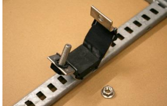
Câbles en trèfle