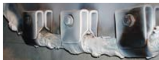
Les clips Phoenix ont été testés contre les incendies conformément à la norme BS 8491 et BS 5839-1.